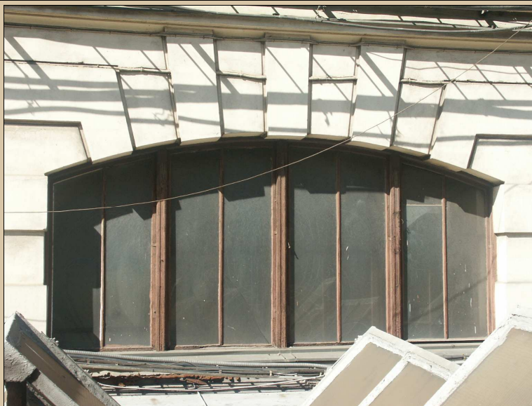
celkový pohled z exteriéru

Po dokončení opravy rámu nechat restaurátorem zkontrolovat vitráž.