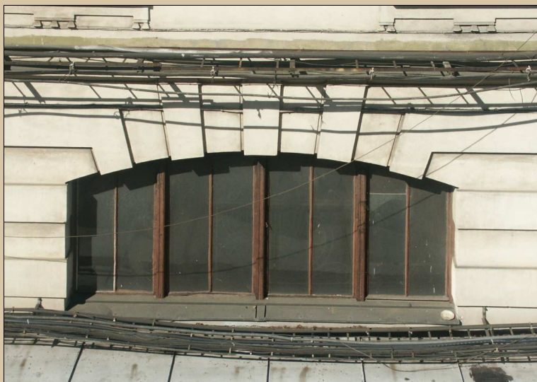
celkový pohled z exteriéru