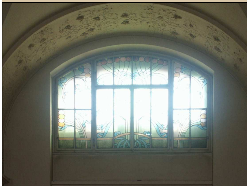
celkový pohled z interiéru